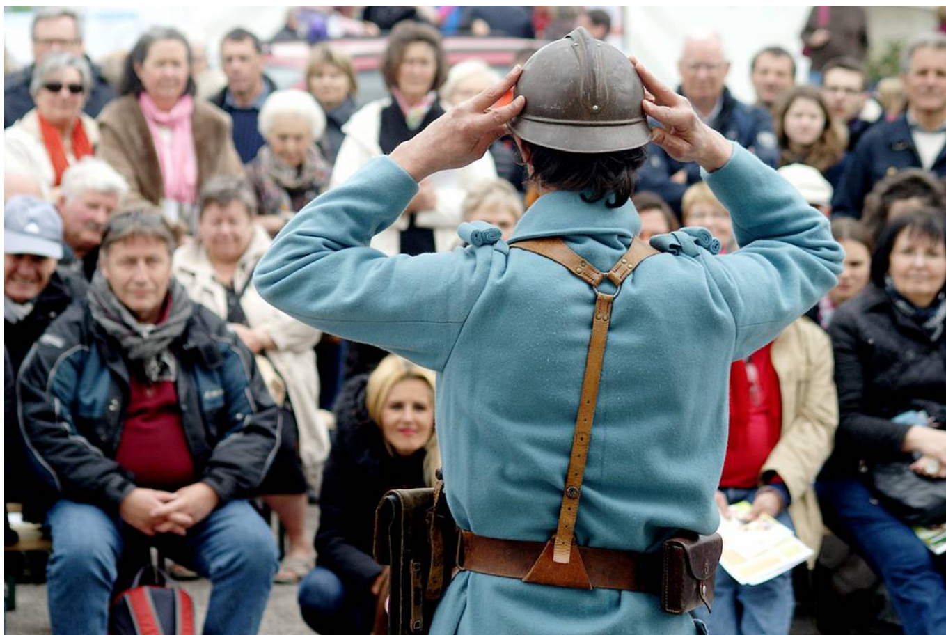
Craonne – Centenaire de la Bataille du Chemin des Dames – 16 avril 2016